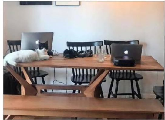
CÓMODO.— Don Draper, el gato, posa sobre la mesa del comedor del departamento que habita en Providencia.