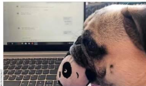
En casa. Paul, de raza pug, ha acompañado a sus dueños durante la última semana de teletrabajo.

su día laboral en su departamento. "Igual es rico porque uno se sienta a trabajar y tu perro está al lado. De repente se tira arriba del computador, pero yo creo que, dentro de todo, ellos son los más contentos, porque están contigo todo el día".