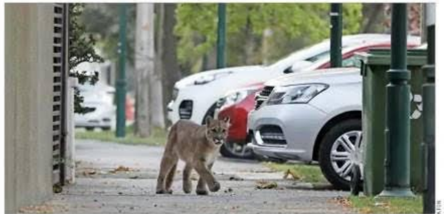
OPERATIVO. — Luego de casi cuatro horas de persecución por Providencia y Ñuñoa, personal del SAG, el Parque y Carabineros lograron retener al felino en el patio de un edificio de Diego de Almagro con Celerino Pereira.

Aunque se desconoce su procedencia, la principal hipótesis es que el puma bajó desde el sector del cerro Manquehue y se aventuró a explorar las calles al no ver presencia humana. Desde esa zona, pasando por Providencia, y hasta el punto donde fue capturado, hay alrededor de 15 kilómetros.