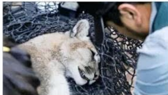
CAPTURA. — El animal fue sedado en el patio de un edificio, ya que podría haber huido luego de recibir el dardo tranquilizante.

do muy lejos, se hubiese metido que, en estas circunstancias (de