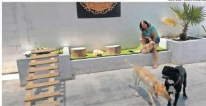
EL HOTEL PARA MASCOTAS SIGUE EN FUNCIONAMIENTO, PERO CON MEDIDAS SANITARIAS EXTRAS.